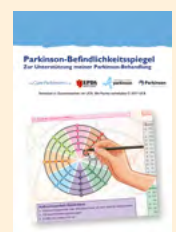
Parkinson- Befindlichkeits- spiegel

Kostenlos erhältlich bei Parkinson Schweiz. www.parkinson.ch > Shop > Gratisbroschüren, 043 277 20 77