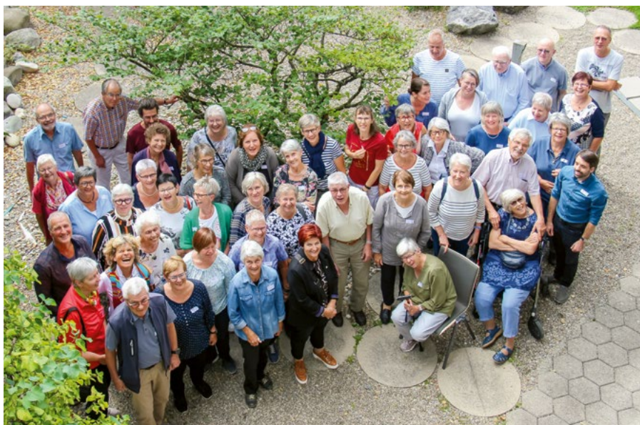
Il corso di perfezionamento per i team di conduzione ha potuto contare su una cinquantina di partecipanti.

La creatività, l'entusiasmo e le idee su come portare avanti l'attività dei gruppi sono presupposti fondamentali per dare un senso di comunità. Gli scambi avvengono su un piano di parità. Si tratta di una modalità d'incontro priva di stigmatizzazioni, in cui le persone si sentono valorizzate e si fidano le une delle altre. I gruppi di auto-aiuto sono preziose fonti di sapere e canali affidabili per uno scambio d'idee senza fronzoli su argomenti che toccano molti aspetti della vita.